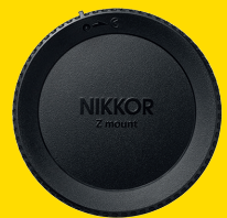
HINTERER OBJEKTIVDECKEL LF-N1