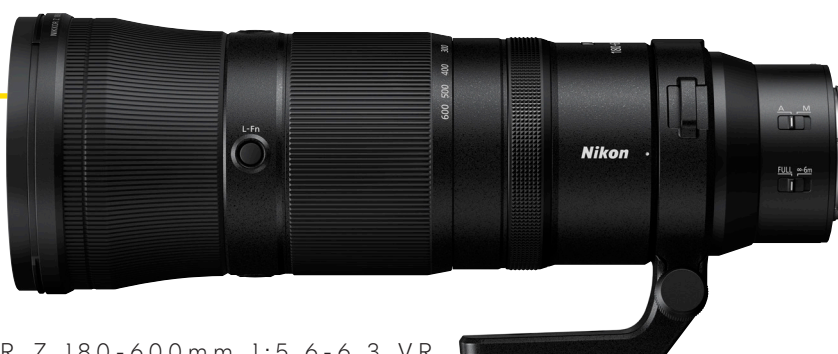
NIKKOR Z 180-600mm 1:5,6-6,3 VR